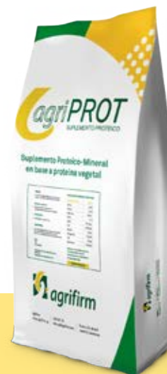
Suplemento proteico mineral en base a proteína vegetal