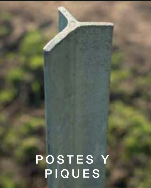
POSTES Y PIQUES