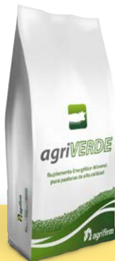
Suplemento Energético-Mineral para pasturas de alta calidad

Sabías que sirven para mejorar el aprovechamiento del campo naturales y las pasturas sembradas.